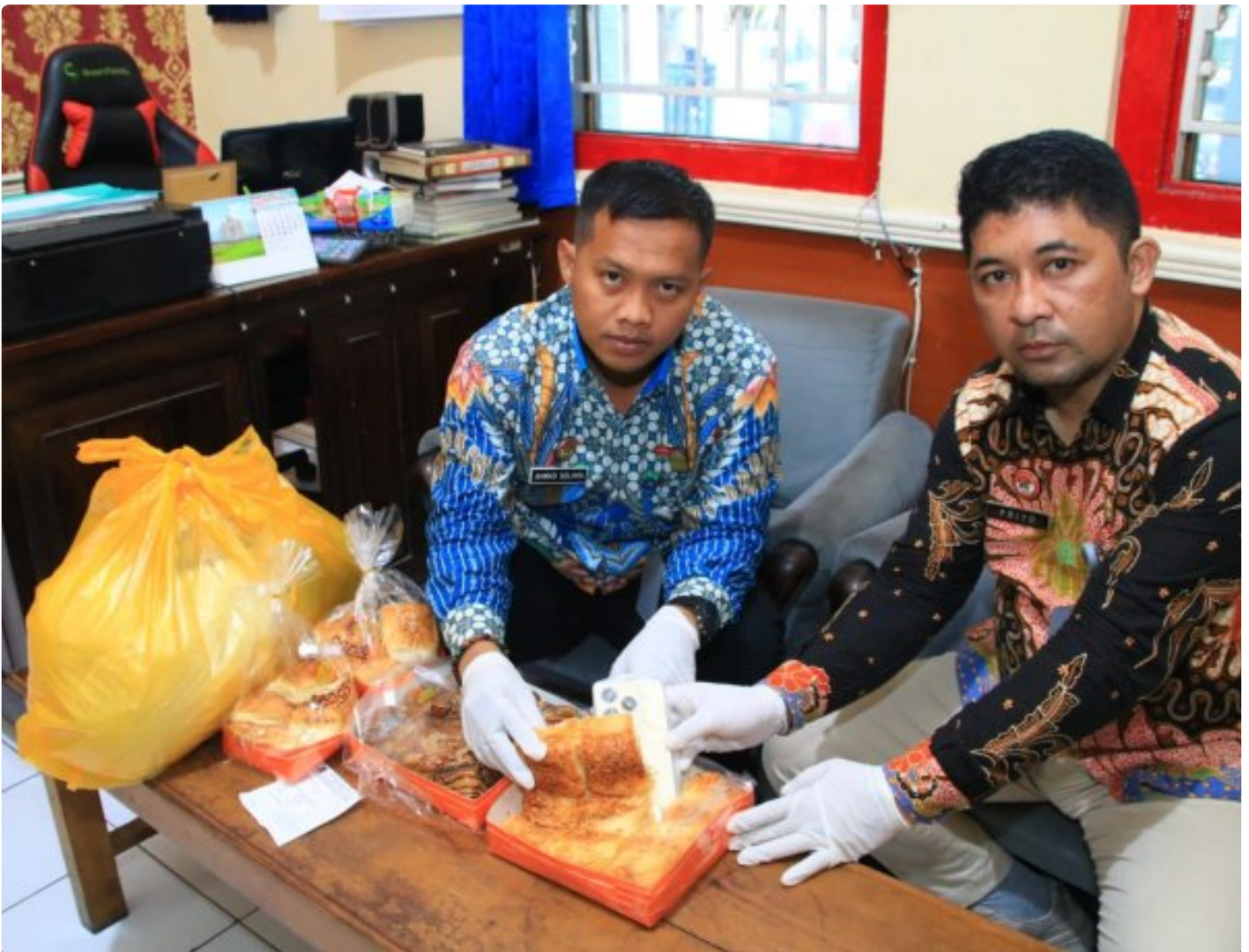
Petugas Lapas Banyuwangi berhasil menggagalkan penyelundupan HP ke dalam lapas

BANYUWANGI - Petugas Lembaga Pemasyarakatan (Lapas) Kelas IIA Banyuwangi berhasil menggagalkan upaya penyelundupan handphone ke salah satu narapidana, Sabtu (18/1/2025). Handphone itu akan diselundupkan oleh B