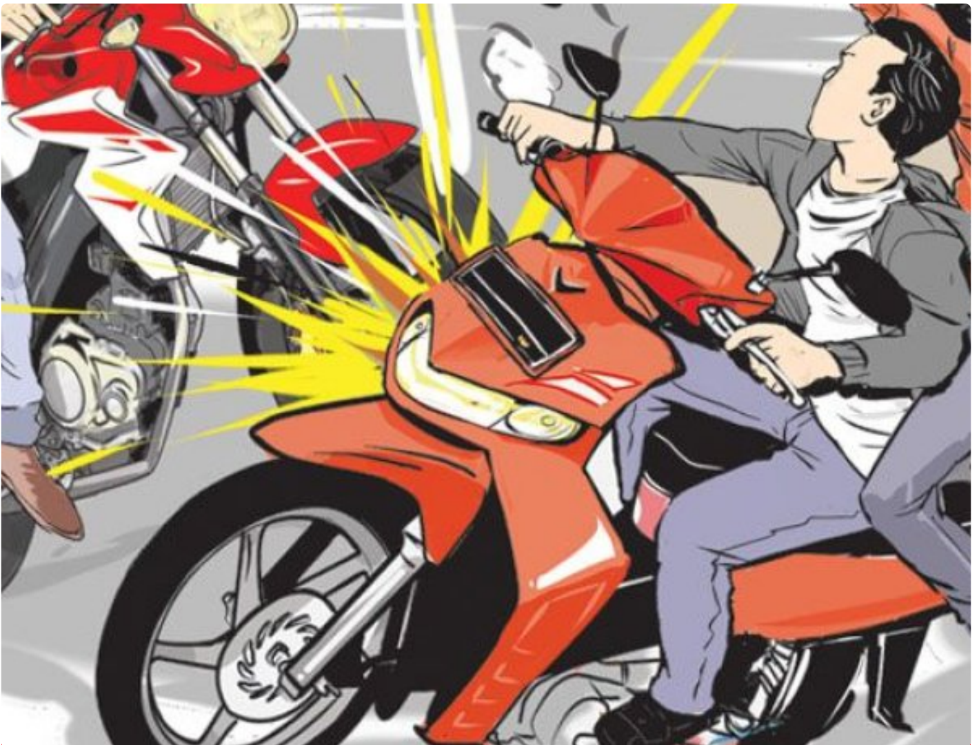
Ilustrasi laka lintas

BANYUWANGI - Dua unit sepeda motor mengalami kecelakaan lalu lintas adu banteng di Jalan Raya Jember, Desa Tulungrejo, Kecamatan Glenmore, Kabupaten Banyuwangi, Jawa Timur. Lakalantas yang melibatkan sepeda motor